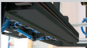
Mais fardos por bobina de filme.