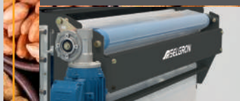
Facilidade no tracionamento do filme.